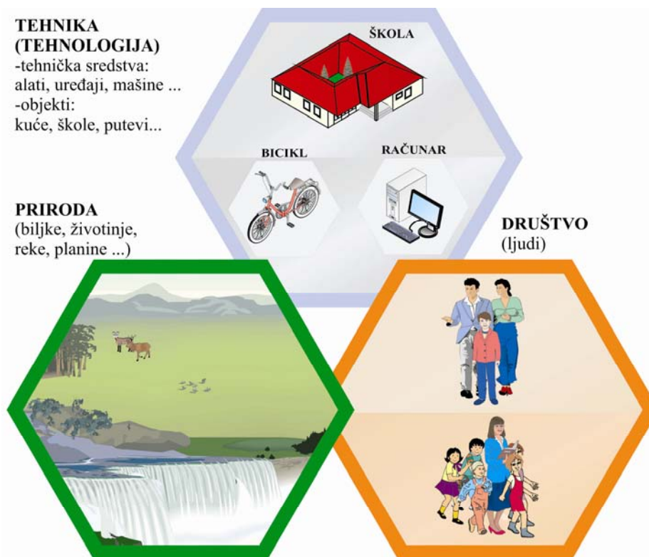
1. Životno okruženje - Svet oko nas

Obrazovne standarde imaju gotovo sve zemlje Evrope. Nacionalni prosvetni savet usvojio je maja 2009. godine dokument pod nazivom Obrazovni standardi za kraj obaveznog obrazovanja za deset predmeta. (srpski jezik, matematika, istorija, geografija, biologija, fizika, hemija, muzička kultura, likovna kultura i fizičko vaspitanje). Predmet tehničko i informatičko obrazovanje je u grupi obaveznih predmeta u okviru drugog ciklusa (peti, šesti, sedmi i osmi razred) zastupljen je u Nastavnom planu sa po dva časa nedeljno. Nedopustivo je da za takav predmet ne postoje obrazovni standardi. Od 2006. godine čine se naponi da Zavod za vrednovanje kvaliteta obrazovanja i vaspitanja uvrsti u proceduru donošenja standarda postignuća za tehničko i informatičko obrazovanje. Osnova za izradu standarda je nastavni Plan i Program čije se polazište nalazi u životnom okruženju (slika 1.)